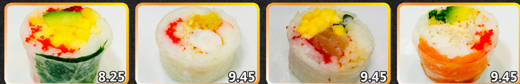
SR1. Tropicana 8.25 Mangue, fraises, menthe, avocat, caviar, sauce épicée SR2. Oceana 9.45 Chair de crabe, goberge, crevette, caviar, tempura SR3. Atlantique 9.45 Saumon épicé, mangue, menthe, caviar SR4. Pacifique 9.45 Chair de crabe, saumon fumé, avocat, asperge, caviar, tempura