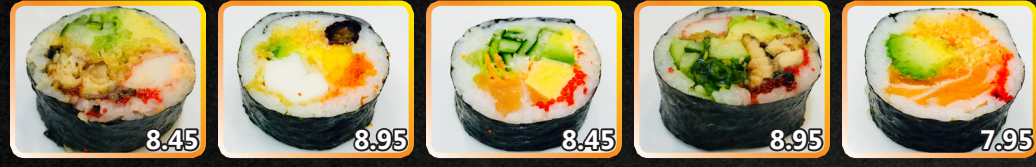
F36. Unakyo 8.45 Anguille grillée, concombre, avocat, concombre, sauce teriyaki, tempura F37. Osaka 8.95 Pétoncle frit, tempura, caviar, bleu, avocat, caviar F38. Paradise 8.45 Saumon épicé, omelette, caviar, laitue, avocat, concombre, carotte F39. Catapilla 8.95 Anguille, goberge, oshinko, wakame, concombre, avocat, caviar F40. Saumon grillé 7.95 Saumon grillé, caviar, avocat, tempura, carotte, sauce épicée