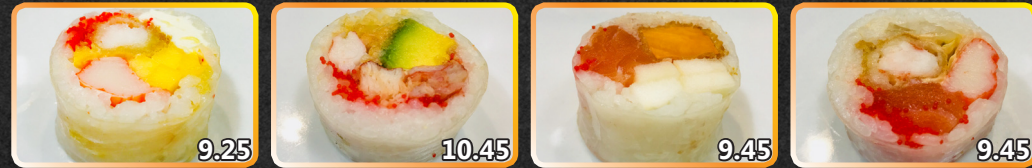
SR9. Tempura 9.25 2 crevettes katsu épicées, goberge, mangue, fromage à la crème, caviar SR10. Blue Ocean 10.45 Homard, crevette, caviar, avocat, tempura SR11. Fuki Maki 9.45 Saumon épicé, crabe des neiges, caviar, patate douce, pomme SR12. Pink Lady 9.45 Saumon, crevettes panées, caviar, goberge, laitue