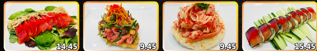
S5. Thon Tataki 14.45 Longe de thon légèrement saisie avec champignons japonais sautés avec sauce teriyaki maison et à l'orange et caviar S6. Feuille d'automne 9.45 Thon, mangue, salade, carotte frite, caviar, sur une feuille oba shiso tempura S7. Lovers 9.45 Crevette, goberge, mayo épicée, menthe, échalotte sur soufflé de crevette S8. Jade 15.45 Thon, mangue légèrement pané, caviar, sauce du chef