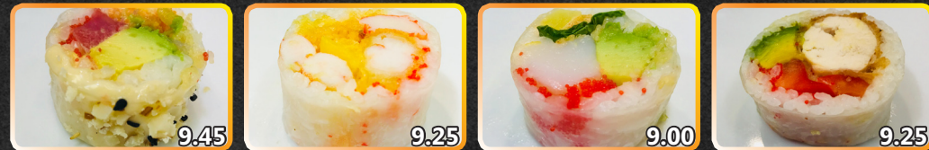
SR5. Sun Flower 9.45 Thon épicé, avocat, caviar, carotte, tempura, noix mixtes SR6. Tutti Fruiti 9.25 Crevettes, crevettes panées, ananas, caviar, goberge, tempura SR7. Moonlight 9.00 Pétoncle épicé, avocat, laitue, radis mariné, tempura SR8. Tori Bomb 9.25 Poulet croustillant, avocat, caviar, poivron, sauce teriyaki