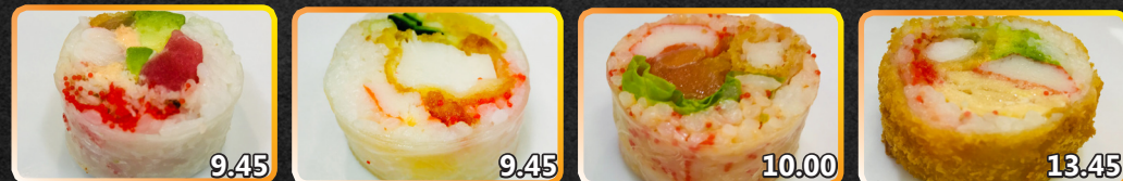
SR13. Red Eye 9.45 Int.: Crabe des neiges, crevette, caviar, oignon frit, avocat. Ext.: Thon SR14. Snowball 9.45 Pétoncle frit épicé, goberge, oignon frit, concombre SR15. Ohlala 10.00 Crevette katsu, saumon, goberge, laitue, mayo épicée SR16. Crispy Roll 13.45 Escobar, crevette katsu, goberge, avocat, caviar, mayo épicée