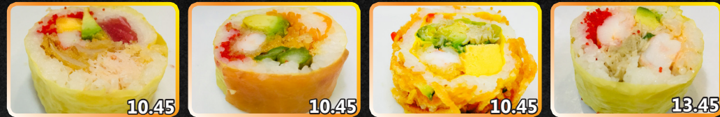
SS1. Élysée 10.45 Thon crabe, goberge, tempura, mangue, avocat, oignon frit, caviar SS2. Fleur de lys 10.45 Saumon fumé, crevette panée, tempura, asperge, avocat, carotte SS3. Rêve d'automne 10.45 Légumes panés, zucchini, patate douce, poivron, oignon, crevette panée, omelette, laitue, avocat, champignon sauté SS4. Homard suprême 13.45 Queue de homard panée, avocat, champignon sauté, crevette, caviar