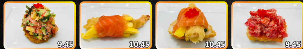
S1. Feuille de tartare (2 mcx) 9.45 Tartare de saumon épicé avec laitue, mangue, ananas, avocat sur canapé de patate douce S2. Crevette Royale (4 mcx) 10.45 Crevette panée dans une roulade de saumon fumé et mangue servis avec une sauce émulsion de sésame S3. Perle de mer (4 mcx) 10.45 Bouchées de saumon, crevette, menthe, caviar, radis japonais avec sauce teriyaki ou agrume S4. Les Demoiselles (2 mcx) 9.45 Tartare de thon épicé avec poivron et saumon fumé déposé sur un lit de riz pané