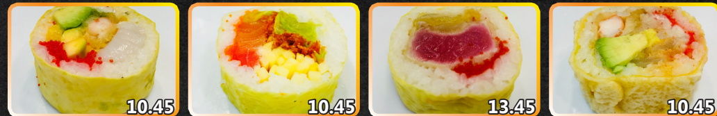
SS5. Mangue délice 10.45 Crevette panée, mangue, pétoncle, avocat, caviar SS6. Jardin d'Éden 10.45 Thon épicé, saumon, mangue, carotte frite, laitue, caviar SS7. Flowers 13.45 Thon grillé léger, caviar, oignon frit, sauce du chef SS8 Lotus 10.45 Hamachi, crevette katsu, avocat, oignon frit, oba shiso, caviar, mayo épicée