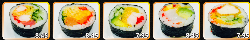
F31. Spécial Kokoro 8.45 Thon, crevette, goberge, tempura, concombre, laitue, sauce épicée F32. Exotica 8.45 Mangue, fraise, menthe, saumon épice, tempura, caviar F33. Hawaii 7.95 Crevette, ananas, avocat, caviar, tempura, concombre F34. Geisha 8.45 Pétoncle épicé, fraise, avocat, caviar, tempura, mangue F35. Kara-Age 7.95 Poulet frit, sauce teriyaki, concombre, tempura